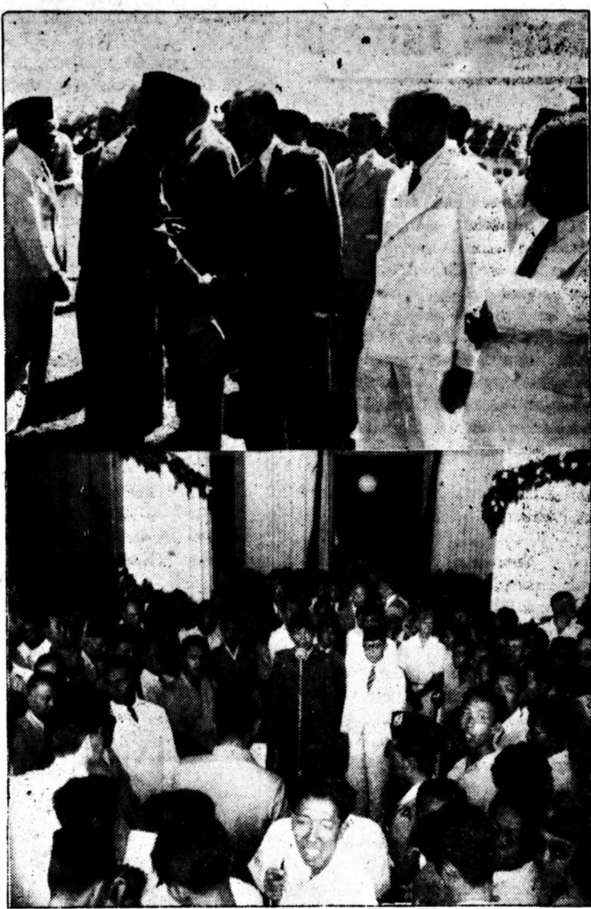
Gambar atas: Ketika tibanya Presiden Sukarno beserta rombongan di lapangan terbang Maguwo para wakil2 KPBB dan pembesar2 lainnya telah siap untuk menjemput. Disini tampak Presiden sedang berjabat tangan dengan Critchley dan disebelah kirilihatan Hatta.

Menurut All India Radio pagi ini, bahwa 200 orang pemerontak Malaya telah terdesak kedudukannya di bagian lembah pegunungan yang lebarnya 30 mil dari Ipoh berhubung dengan serangan2 yang dilakukan angkatan udara Inggeris beberapa hari ini terhadap mereka. Dalam pada itu pemerintah Inggeris telah menegerahkan tenaga2 yang berupa polisi, tentera dan angkatan udara untuk menkepung kaum pemerontak yang terdesak itu hingga menjerah.